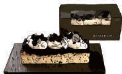
ニューヨークチーズケーキ 1800