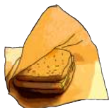
アイスブリュレサンド (6月～9月) 350