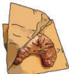
クロワッサンシュー (9月～5月) 350